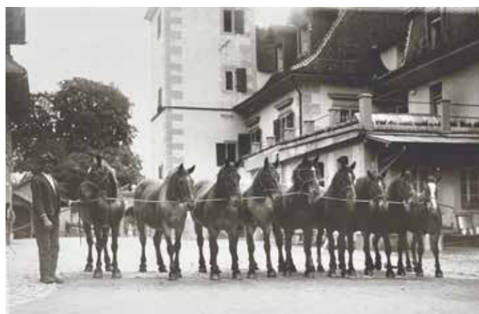
Utzigen war bis weit über die Kantonsgrenzen hinaus bekannt für die Zucht von Pferden, Rindern und Schweinen.