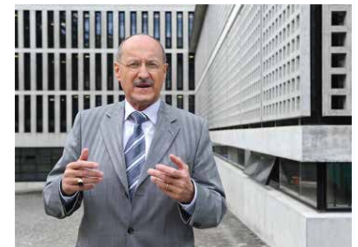
Auf dem Thorberg.

Es war mir immer wichtig, niemals bewusst die Würde eines Menschen zu verletzen oder jemanden vor anderen blosszustellen. Diese Haltung bestimmt meinen Umgang mit anderen und prägt mein Handeln.