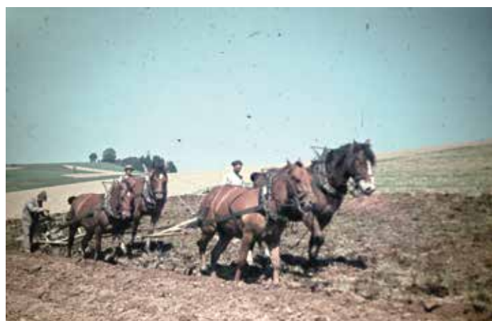
Die erfolgreiche Landwirtschaft sicherte die Versorgung mit Nahrungsmitteln und brachte durch den Verkauf von Landwirtschaftserzeugnissen und Tieren wichtiges Einkommen.