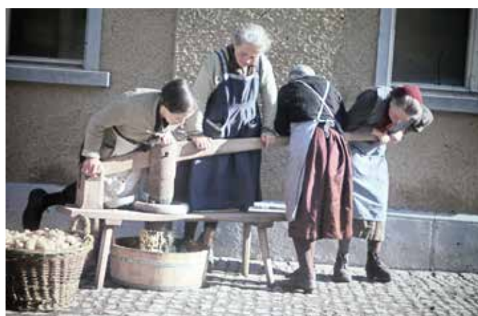
Früher waren die Bewohnenden Selbstversorger/innen, sie mussten hart arbeiten, damit etwas zu Essen auf den Tisch kam.

Die Ausstellung «Stumme Zeitzeugen» gibt Einblick in die ersten zwei Drittel der 150-jährigen Geschichte des Wohn- und Pflegeheims Utzigen. Sie beleuchtet eine Zeit, in der das