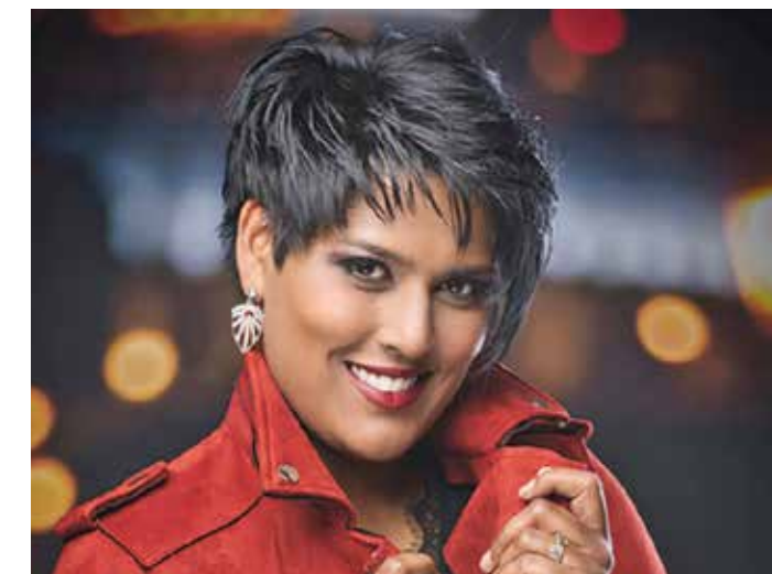
Die Schlagersängerin Sarah-Jane tritt am Sommerfest auf

Am 14. Juni ist die Öffentlichkeit herzlich ans Sommerfest eingeladen, das ebenfalls ganz im Zeichen des Jubiläums steht. Für die musikalische Unterhaltung sorgt am Vormittag die Musikgesellschaft Utzigen und nachmittags die bekannte Schlagersängerin Sarah-Jane. Wir freuen uns, mit Ihnen zu feiern!